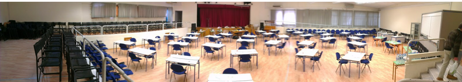
Ο χώρος της εκδήλωσης