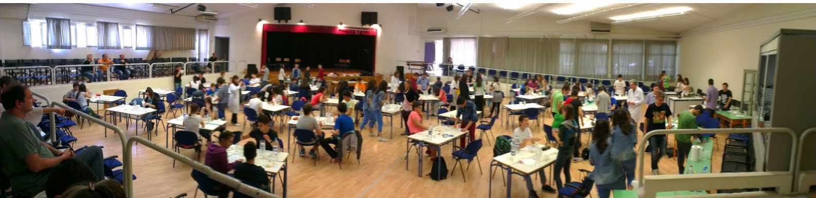
Οι μαθητικές ομάδες εν δράσει!

Παρακάτω παραθέτουμε χαρακτηριστικά στιγμιότυπα από τη δράση και στο τέλος του αρχείου το πρόβλημα που τους ζητήθηκε να αντιμετωπίσουν.